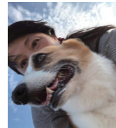
〈すくすく畑・天然おやつ屋ととて〉