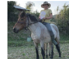
〈発酵自然食アカデミー・しあわせ工房〉